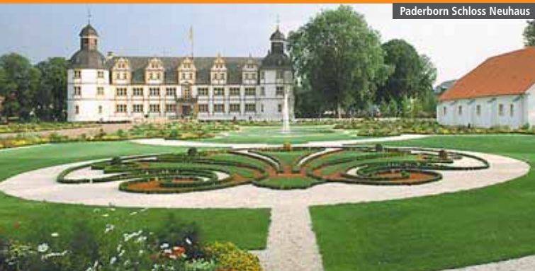
Paderborn Schloss Neuhaus

Schloß Holte-Stukenbrock auszeichnet. In der ostwestfälischen Metropole Bielefeld sind vor allem die Sparrenburg und die Altstadt sehenswert. Ein ganz anderes Landschaftserlebnis bietet die Senne im Paderborner Land rund um Hövelhof mit blühender Heide, duftenden Kiefernwäldern und glasklaren Bächen. Prächtiger Endpunkt der Tour ist Paderborn, die altehrwürdige Dom- und moderne Universitätsstadt.