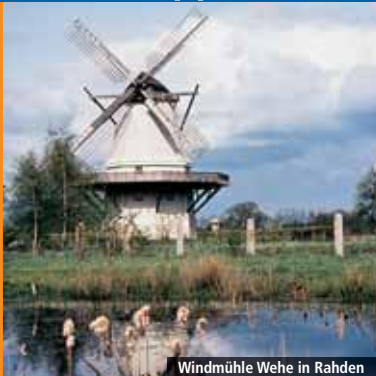
Windmühle Wehe in Rahden

Die BahnRadRoute Weser-Lippe von Bremen über Bielefeld nach Paderborn ist mit über 300 Kilometern Länge mit Abstand die längste der drei BahnRadRouten. Sie beginnt in der traditionsreichen Hansestadt Bremen, wo mit dem Roland und den Stadtmusikanten bereits bekannte Sehenswürdigkeiten an der Strecke liegen. Alten Hansewegen folgend geht es quer durch den niedersächsischen Landkreis Diepholz. Es folgen der reizvolle Mühlenkreis Minden-Lübbecke, das Wittekindsland Herford und die alte Leinenweberstadt Bielefeld.